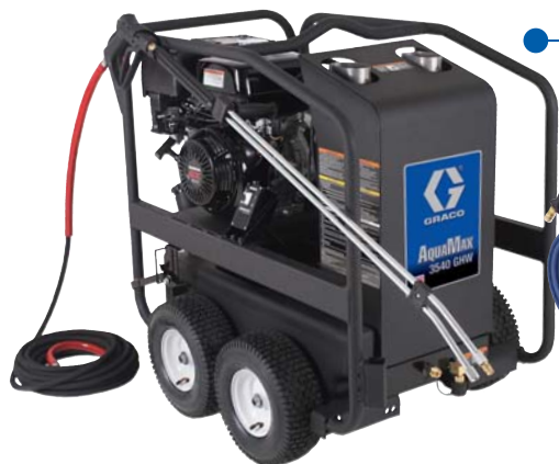
Hot Direct drive