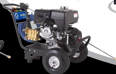
Cold Direct Drive