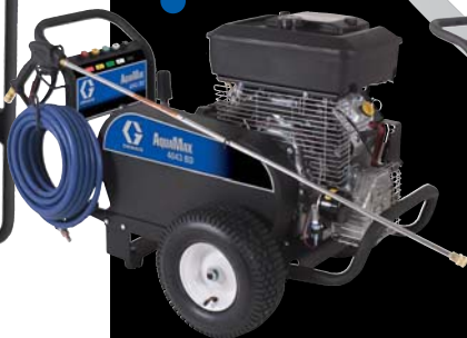
Cold Belt Drive